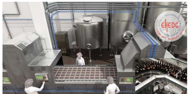
設置例・食品製造ライン

X-トレイ最大の特長は、ワイヤー構造であることで、軽量・シンプルな構造により、持ち運びしやすく、組立・据付が効率よく作業できる様に設計されている点です。