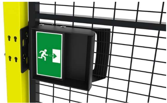
パニックロック機能